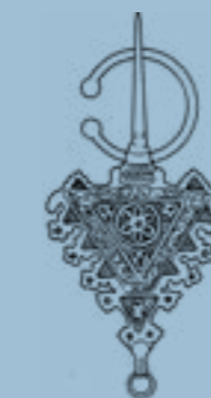
Associazione Culturale Berbera